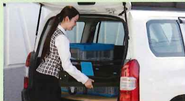
車の荷台にも簡単に積めます。