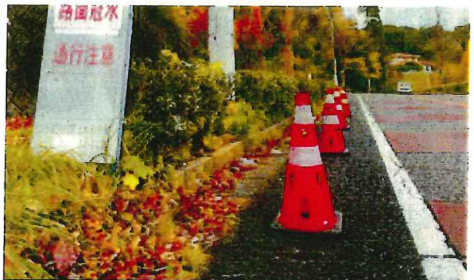
路肩の注意喚起などに