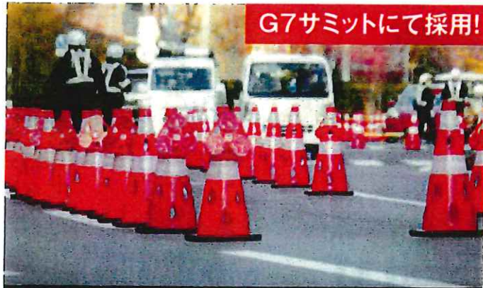
G7サミットにて採用!