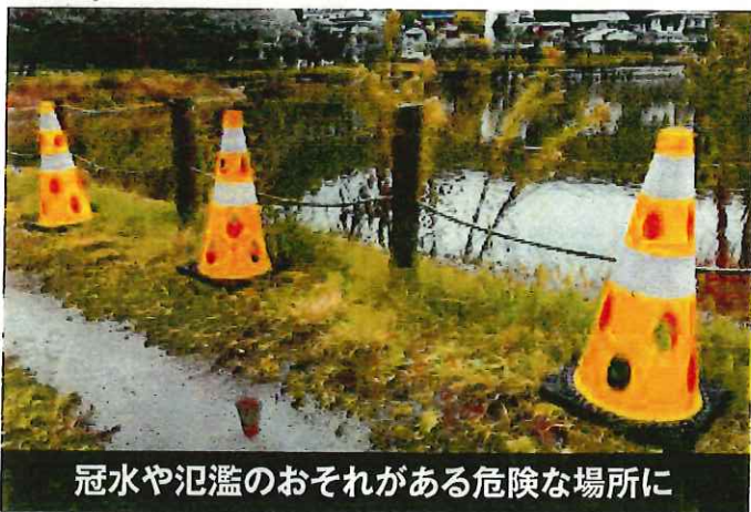
冠水や氾濫のおそれがある危険な場所に