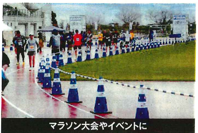
マラソン大会やイベントに